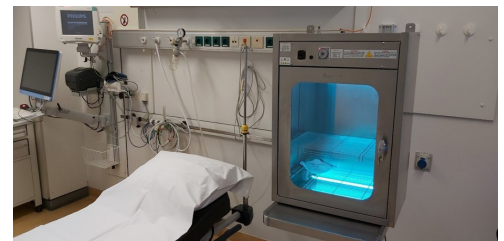
Trattamento mascherine e attrezzature medicali

La tecnologia UV-C è un metodo di disinfezione fisico con un ottimo rapporto costi/benefici, è ecologico e, al contrario degli agenti chimici, funziona contro tutti i microrganismi senza creare resistenze.