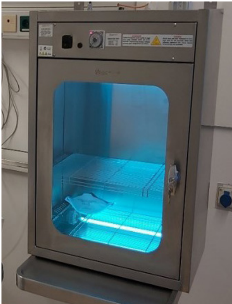
Trattamento UV-C su mascherina di protezione medica